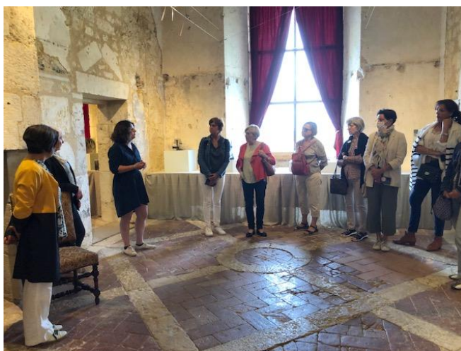
Photo visite château de Lavardens

Puis Visite récréative des verreries exposées au château de Lavardens.