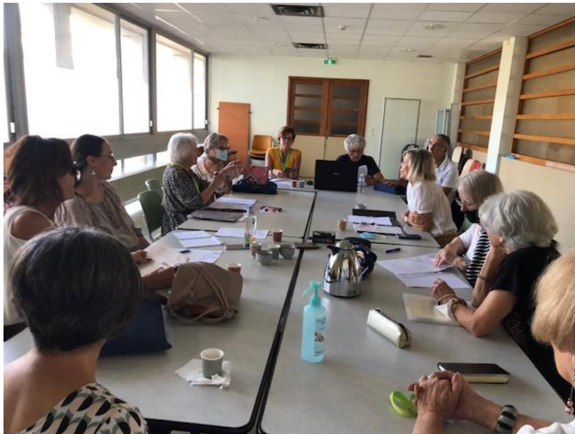
Photo conseil d'administration

Quatre conseils d'administration ont eu lieu en 2021/2022 : 17 février 2022, 7 avril 2022, 6 juin 2022 et 15 septembre 2022. Ils ont réalisés ou traités des différents points se présentant tout au long de l'année. Les comptes rendus rédigés ont été envoyés aux responsables de chaque section locale et sont à disposition de chaque bénévole qui en font la demande.