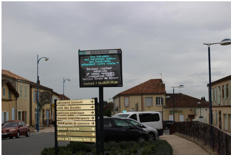
Photo Panneau lumineux