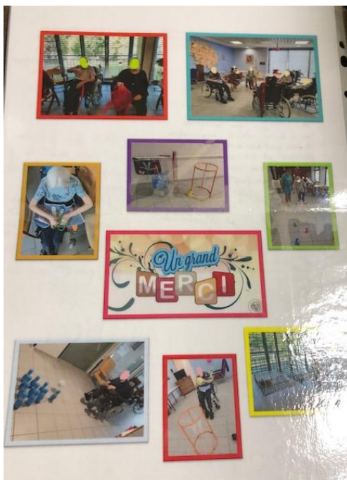
Photo merci matériel don OKOFEN

Il a été remis le don offert par OKOFEN : Il a été confié ainsi 200 euros à l'Animatrice du Centre Hospitalier. Voici présenté le message de remerciement qui nous a été adressé.