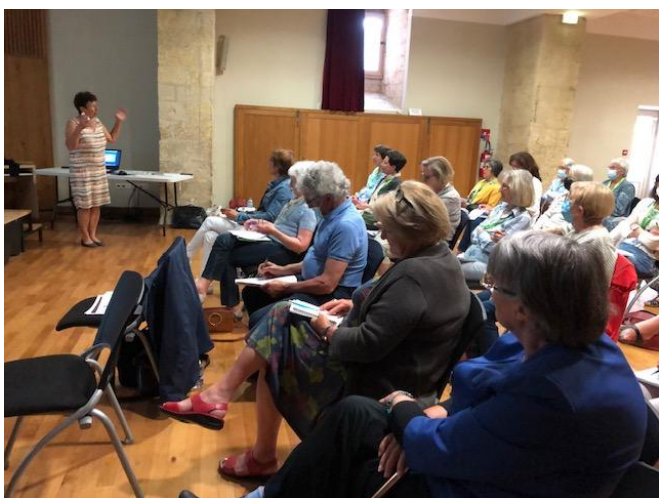
Photo formation du 12 mai 2022