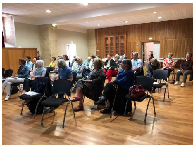
Photo 12 mai 2022 une assemblée attentive

Visionnage commenté du PowerPoint « ALIMENTATION ET PERSONNES ÂGÉES ». Des discussions et réflexions s'en suivent.