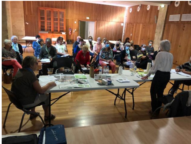
Photo formation 18 oct 2022

À partir de cette présentation et des échanges, mise en place de 4 ateliers de réflexion et de débats.