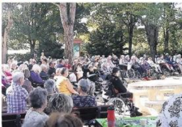
Pendant le spectacle dans le parc de l'hôpital Saint-Jacques.