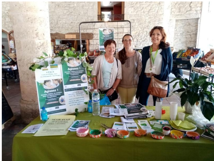
Photo équipe de Mauvezin