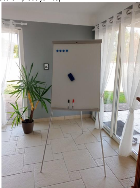
Photo tableau velleda