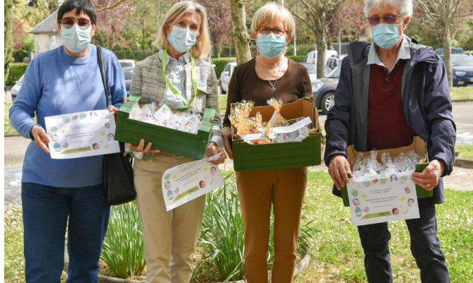
Photo Pâques Mirande